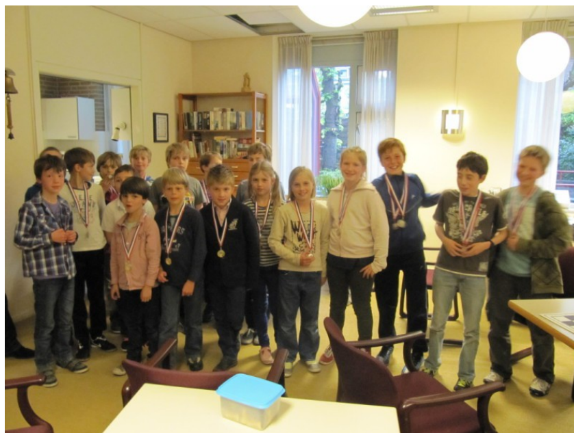
Afbeelding 3: Prijsuitreiking Interne competitie periode 3 en 4 (2012-2013)

Er zijn vier periodes per jaar en dus vier kansen om te promoveren. De prijsuitreikingen vinden plaats samen met de uitreiking van de stappendiploma's, twee keer per jaar. Dit betekent dat de prijzen voor de eerste periode pas worden uitgereikt in januari en evenzo de derde periode pas in juni.