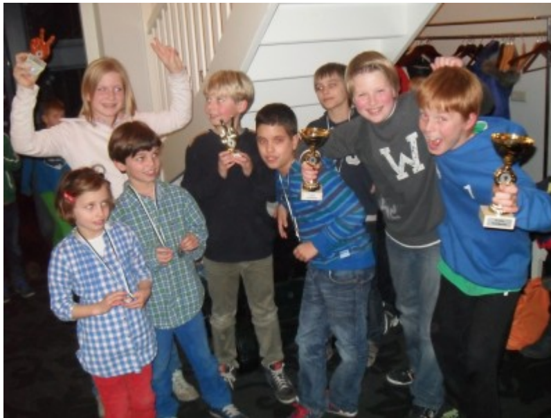
Afbeelding 4: Baarnse jeugd bij Grand Prix Woerden (2013)

Voor de jonge leden zijn de Grand Prix-toernooien van de SGS heel geschikt om voor het eerst een echt toernooi te spelen. Wij organiseren één maal per seizoen zelf zo'n toernooi. Bij elk Grand Prix-toernooi worden kinderen ingedeeld in groepen van 8 tot 10 op speelsterkte (en dus niet op leeftijd) en spelen ze in deze groep alle partijen. In de lagere groepen gebeurt dit zonder klok. Een Grand Prix-toernooi is geschikt voor iedereen die de regels van het schaakspel kent en heeft zo rond de 80 deelnemers.